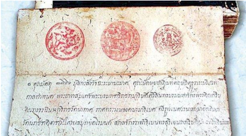
ภาพที่ 1 กฎหมายตราสามดวงที่เกิดขึ้นในช่วงสมัยรัชกาลที่ 1

2337) อีกคำรบหนึ่ง ดั่งนั้นการใช้อำนาจรัฐกระทำ หรือไม่กระทำ เป็นกลไกร่วมระหว่างรัฐกับศาสนา ดั่งให้มีการออกกฎหมายตราสามดวง (พ.ศ.2347) เพื่อควบคุมพระสงฆ์ในสมัยรัชกาลที่ 1 (พ.ศ.2325-2352) การตั้งกองสังฆการีเพื่อพิจารณาคดีความเกี่ยวกับพระสงฆ์ในสมัยรัชกาลที่ 2 (พ.ศ.2352-2367) ล่วงมาจนกระทั่งการตราพระราชบัญญัติคณะสงฆ์ ร.ศ.121 (พ.ศ.2445) ทำให้มีองค์กรจัดตั้งที่เรียกว่ามหาเถรสมาคม ในสมัยรัชกาลที่ 5 (พ.ศ.2411-2453) การตั้งกรมสังฆการี กรมพระอาราม กองอธิกรณ์ มีหน้าที่ดูแลกิจการพระพุทธศาสนา อยู่ภายใต้กระทรวงธรรมการ ในสมัยรัชกาลที่ 6 (พ.ศ.2453-2468) และพระราชบัญญัติคณะสงฆ์ในช่วงเวลาต่าง ๆ ผ่านการจัดตั้งกรมการศาสนา (พ.ศ.2884) สำนักงานพระพุทธศาสนา (3 ตุลาคม 2545) ที่นัยหนึ่งเป็นผู้ดูแลอีกนัยหนึ่งเป็นการบริหารจัดการในนามรัฐที่ส่งต่อไปยังกลุ่มองค์กรทางศาสนาพุทธในประเทศไทย ดั่งนั้นความสัมพันธ์ระหว่างรัฐกับศาสนาจึงเป็นกลไก เครื่องมือ และการขับเคลื่อนในฐานะ “รัฐ” พึ่งดำเนินต่อ “ศาสนา-ประชารัฐ” อันเป็นกลไกขับเคลื่อนสังคมในองค์รวม ซึ่งจะนับว่าศาสนาถูกควบคุมโดยกลไกแห่งรัฐก็ไม่ผิด