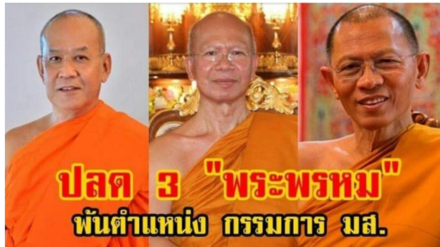
ภาพที่ 6 การล้อมปราบต่อกลุ่มสมาชิกทางศาสนาในรัฐ ปราบฏการณรัฐกับศาสนาอย่างไทย ในช่วงเดือนพฤษภาคม 2561 (ภาพ : ออนไลน์)

หาจุดเชื่อมและจุดแยกระหว่างกันได้ ดังนั้นการจัดวางความเหมาะสมระหว่างรัฐ ที่นัยหนึ่งต้องทำหน้าที่ในฐานะองค์อธิปัตย์ อีกองค์หนึ่งในรัฐ และในอีกความหมายหนึ่งรัฐจะต้องเป็นผู้อุปถัมภ์ และดำเนินสถานะของความเป็น “ผู้ปกครอง” มีคำถามว่ารัฐกับศาสนาในมิติของความสัมพันธ์ในอนาคต ควรมีบทบาทและการออกแบบบทบาทพร้อมกันอย่างไร รัฐกับศาสนาดำเนินบทบาทพร้อมกันในความเป็นรัฐและศาสนา หรือในอีกความหมายเป็นการจัดวางแบบหลวม ๆ ในฐานะรัฐและศาสนาที่จะพึงดำเนินการร่วมกัน แม้พระพุทธเจ้าเองได้วางแนวคิดในเรื่อง “อนุญาตให้อนุโลมตามบ้านเมืองได้” (วิ.มทา.(ไทย) 4/186/295) หรือหลักความสอดคล้องประสานอย่าง “มหาปเทศ” (วิ.มทา.(ไทย) 5/305/139-หลักมหาปเทศ 4) ที่ให้อนุโลมยอมตามได้ แต่คำว่าอนุโลมหมายถึง ต้องไม่ขัดกับพระธรรมวินัย หลักการ อันเป็นเป้าหมายในเชิงอุดมคติตามหลักศาสนา จากภาพสะท้อนมุมมองของรัฐกับศาสนาและท่าที ยังเป็นแนวคิดที่จะยังคงรอเวลาและคำอธิบาย พร้อมถกเถียงอภิปรายร่วมกัน หนังสือที่สรุป ทวีศักดิ์ เขียนได้เป็นบทบันทึกสะท้อนคิดหนึ่ง แล้วนำมาพิมพ์เผยแพร่ให้ชวนศึกษา ถกเถียงได้อย่างต่อเนื่องไม่แปรเปลี่ยน น่าสนใจ ใส่ใจและติดตามต่อความเคลื่อนไหวทางความคิดอย่างเป็นระบบ