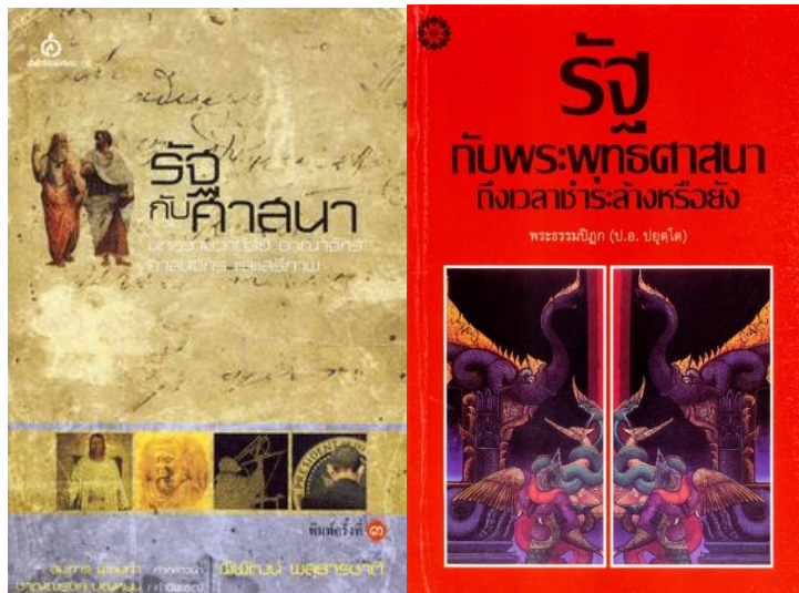
ภาพที่ 2 หนังสือรัฐกับศาสนา สะท้อนคิดว่าด้วยรัฐกับศาสนาที่เกาะเกี่ยวกันในฐานะผู้ให้หลักการแก่รัฐจะพึงไปปฏิบัติ และการอุปถัมภ์ศาสนาในฐานะ “อธิปัตย์” พึงแสดงต่อประชารัฐและศาสนา

เป็นหน่วยสนับสนุนกันและกันที่มีอยู่ในสังคม ที่มีมาต่อเนื่องนับแต่อดีตด้วยเช่นกัน ดังปรากฏในงานของพระธรรมปิฎก (ป.อ.ปยุตฺโต) “รัฐกับพระพุทธศาสนาถึงเวลาชำระล้างหรือยัง” (2525) หรือในงาน “รัฐกับศาสนา : บทความว่าด้วยอาณาจักร ศาสนจักร และเสรีภาพ” (2010) ของพิพัฒน์ พสุธารชาติ (Pipat Pasutharachat, 2010) หรือนักคิดอย่างท่านพุทธทาส (พ.ศ.2449-2536) ที่ถูกตีความว่า “เป็นความคิดแบบประเพณีนิยมที่สนับสนุนคติการปกครองของไทย” (Wanpat Youngmevittaya, 2017.pp.181-224) รวมถึง นิธิ เอียวศรีวงศ์ รัฐควบคุมศาสนา “การที่รัฐไปสร้างให้คณะสงฆ์กลายเป็นองค์กรอันหนึ่งอันเดียวกันนี้ ทำให้รัฐเองก็ระวางภัยอำนาจขององค์กรคณะสงฆ์ ไม่ว่าจะเป็นรัฐสมบูรณาญาสิทธิราชย์หรือหลังจากนั้น รัฐจึงต้องกำกับองค์กรสงฆ์อย่างใกล้ชิด เพราะพระสงฆ์ได้รับความเคารพศรัทธาอย่างสูงจากประชาชนทั่วไป เมื่อกลายเป็นองค์กรขึ้นมา หากเป็นอิสระก็อาจขัดขวางอำนาจรัฐได้มาก” (Nidhi Eosewong, Online : 9 June 2018) แต่สาระโดยรวมเป็นเรื่องว่าด้วยรัฐกับศาสนาในมิติที่หลากหลาย รวมทั้งการ “จัดการ” ภายใต้กลไกหรือองค์ประกอบของสังคมด้วย ที่นัยหนึ่งเห็นว่ารัฐยังคงจำเป็นที่จะต้องให้การสนับสนุน แต่อีกนัยหนึ่งก็เห็นว่าความเป็นปัจเจกระหว่างรัฐและศาสนาจะส่งเสริมเสริมและเปิดโอกาสให้เติบโตมากกว่า เป็นต้น