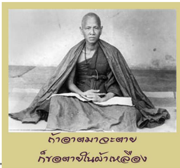
ภาพที่ 3 ครูบาศรีวิชัย กับแนวทางการต่อสู้เพื่อสะท้อนความเป็น “ตนบุญในศาสนา” กับการจัดวางความสัมพันธ์ระหว่างรัฐ ภายใต้สถานการณ์แห่งรัฐสยามในช่วงเปลี่ยนผ่านในช่วงสมัยรัชกาลที่ 5

จากข้อคิดและแนวเสนอนี้ในหนังสือ หรือทัศนะเชิงวิพากษ์ปรากฏทางสื่อออนไลน์ของผู้เขียนได้เสนอแนวคิดชัดเจนในเรื่องศาสนากับรัฐควรแยกกัน โดยเสนอในเรื่องสิทธิเสรีภาพที่จะพึงแสดงออกต่อศาสนา แปลว่าศาสนาเชื่อได้ แต่ต้องเป็นเรื่องส่วนบุคคลไม่ควรเป็นเรื่องที่รัฐ จะเข้าไปบังคับ หรือกลุ่มองค์กรทางศาสนาจะเข้าไป “บังคับ” ซึ่งนำไปสู่ผู้ที่อยู่ใต้ปกครองของรัฐ ต้องกระทำตามเป้าประสงค์หรือเจตจำนงเสมอไป เพราะถ้าเป็นอย่างนั้นเท่ากับว่าศาสนาเป็นเพียงกลไกหนึ่งของรัฐที่ทำหน้าที่ค้ำยันกันและกัน โดยรัฐใช้ศาสนาเป็นเครื่องมือในการสื่อสารศาสนาที่ผสมด้วยความเป็นรัฐ การปกครอง การใช้อำนาจ และบังคับใช้ด้วยเช่นกัน ซึ่งทางออกทางศาสนาจะเป็นเรื่องที่ต้องพิจารณาและพินิจนำเสนอร่วมกันต่อไป