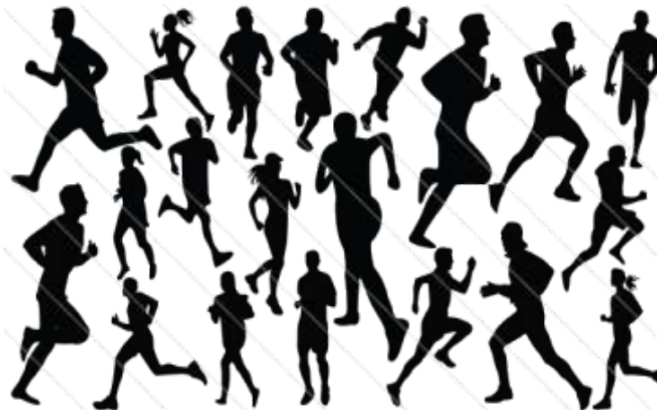
ภาพประกอบ 1 โลกที่ค้นหาด้วยการวิ่งและวิธีการวิ่งสู่เป้าหมาย

ตั้งนั้นหนังสือนี้ จึงกล่าวถึงการวิ่งโดยเป็นเทคนิคของการบริหาร และการจัดการตามรูปแบบของญี่ปุ่นและผู้เขียนคำนิยมได้สะท้อนออกมา ทั้งที่ในฐานะผู้เขียนเคยไปศึกษาได้นำมาถ่ายทอดเป็นประสบการณ์ตรงจึงนำมาเรียบเรียงเป็นเทคนิคทางการบริหารที่อ่านแล้วให้น่าสนใจ ฟังนำมาแบ่งปัน ให้กับผู้อื่นได้รับรู้เป็นความมั่งคั่งทางภาษา สารของเรื่อง และเทคนิคของการเล่าเรื่องถ่ายทอดดังปรากฏในงานเขียนของหนังสือเล่มนี้